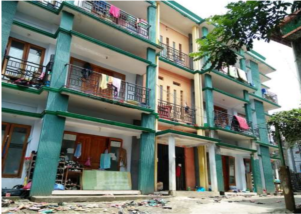
Gedung Asrama santri Putri