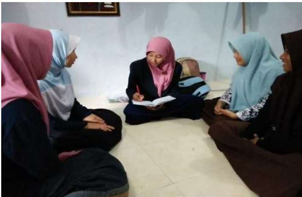
Peneliti wawancara dengan beberapa siswi MBI Amanatul Ummah Pacet Mojokerto