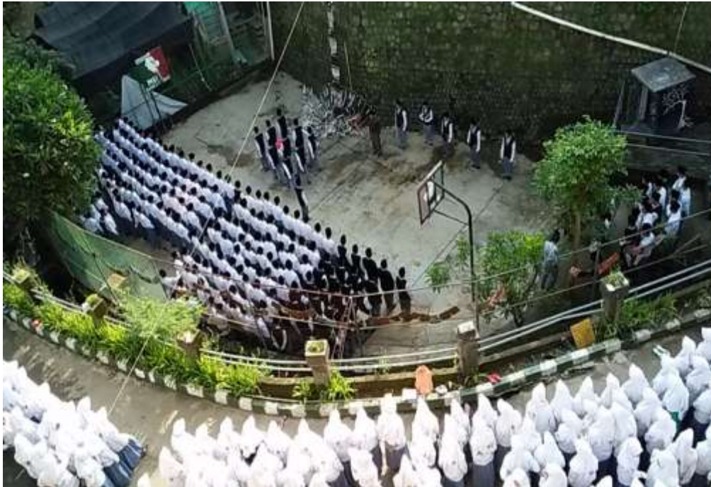
Foto Kegiatan Upacara Bendera dengan menggunakan Bahasa Arab