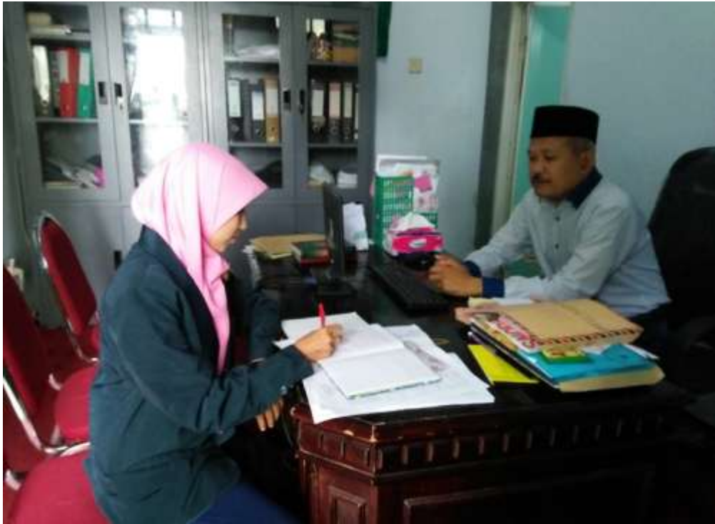
Peneliti wawancara dengan koordinator MBI Amanatul Ummah Pacet Mojokerto